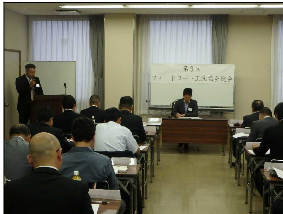
<平成28年6月24日 第3回 Weed-Coat 工法協会 総会>

総会では上記5議案が承認されました。総会 終了後、かどやにて懇親会が行われ盛会のうち に終了しました。