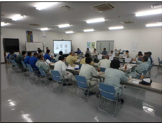
<平成28年7月8日 第5回 Weed-Coat 工法協会 勉強会>

その後、改良を施した除草機械の運転 を兼ね現場へ移動し、協会員様にも実際 に機械に触れて頂き除草機械の情報共有 の場としました。協会員様からの提案 質問事項等については、各協会員様によ る積極的な参加により、今後現場で生か すことのできる創意工夫などの情報を共 有することができました。