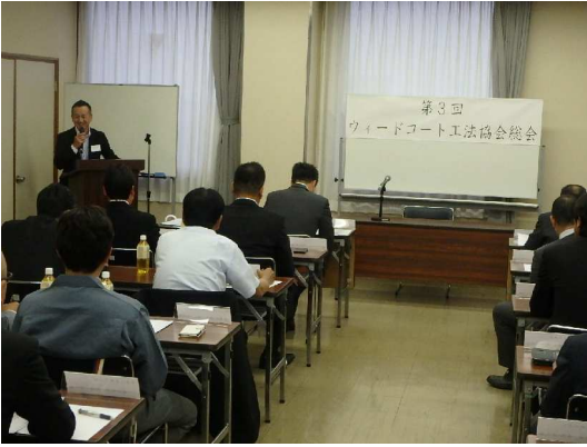
<平成28年6月24日 第3回 Weed-Coat 工法協会 総会>