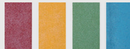
ベンガラ イエロー グリーン ブルー